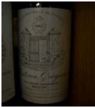
Winzer: Chateau Greysac Gebiet: Bordeaux, Medoc Jahrgang: 1982 Preis: 46,70