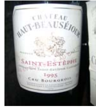
Winzer: Chateau Haut-Beauséjour Gebiet: Bordeaux, Saint-Estéphe Jahrgang: 1995 Preis: 21,70