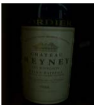
Winzer: Chateau Meyney Gebiet: Bordeaux, Saint-Estéphe Jahrgang: 1985 Preis: 30,10