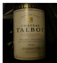
Winzer: Chateau Talbot Gebiet: Bordeaux, Saint-Julien Jahrgang: 1983 Preis: 43,10