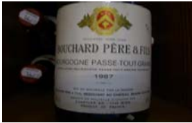
Winzer: Bouchard Père & Fils Gebiet: Burgund, Passetoutgrain Jahrgang: 1987 Preis: 14,05