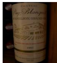
Winzer: Chateau Puy-Blanquet Gebiet: Bordeaux, Saint-Emilion Jahrgang: 1993 Preis: 18,20