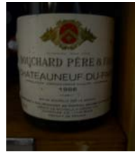
Winzer: Bouchard Père & Fils Gebiet: Rhone, Chateaufort Jahrgang: 1986 Preis: 20,65