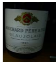
Winzer: Bouchard Père & Fils Gebiet: Burgund, Beaujolais Jahrgang: 1991 Preis: 7,55