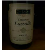
Winzer: Chateau Lassalle, de Luze Gebiet: Bordeaux, Graves Jahrgang: 1985 Preis: 27,91