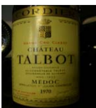
Winzer: Chateau Talbot Gebiet: Bordeaux, Saint-Julien Jahrgang: 1970 Preis: 197,50