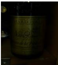
Winzer: Bouchard Père & Fils Gebiet: Rhone, Chateaufort Jahrgang: 1985 Preis: 19,05