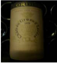
Winzer: Chateau Gruaud-Larose Gebiet: Bordeaux, Saint-Julien Jahrgang: 1979 Preis: 93,90