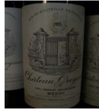
Winzer: Chateau Greysac Gebiet: Bordeaux, Medoc Jahrgang: 1988 Preis: 46,70