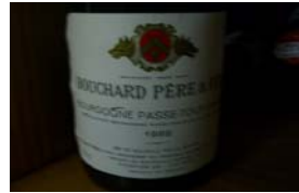
Winzer: Bouchard Père & Fils Gebiet: Burgund, Passetoutgrain Jahrgang: 1988 Preis: 11,75