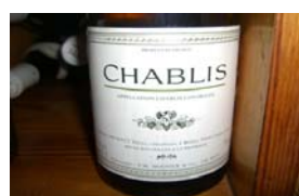
Winzer: Calvet Gebiet: Burgund, Chablis Jahrgang: 1987 Preis: 12,95