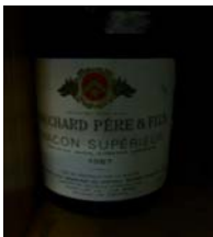
Winzer: Bouchard Père & Fils Gebiet: Burgund, Macon Jahrgang: 1987 Preis: 8,70