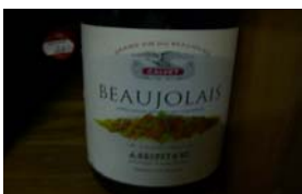
Winzer: Calvet Gebiet: Burgund, Beaujolais Jahrgang: 2000 Preis: 8,50