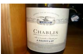
Winzer: Calvet Gebiet: Burgund, Chablis Jahrgang: 1997 Preis: 15,95