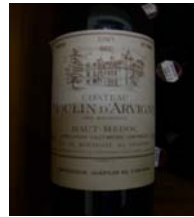
Winzer: Chateau Moulin d'Arvigny Gebiet: Bordeaux, Haut-Medoc Jahrgang: 1985 Preis: 23,10