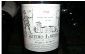
Winzer: Chateau Lagrange Gebiet: Bordeaux, Saint-Julien Jahrgang: 1978 Preis: 46,70