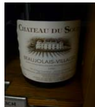
Winzer: Bouchard Père & Fils Gebiet: Burgund, Beaujolais-Villages Jahrgang: 1990 Preis: 8,30