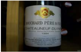
Winzer: Bouchard Père & Fils Gebiet: Rhone, Chateaufort Jahrgang: 1984 Preis: 21,90