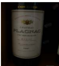
Winzer: Chateau Plagnac Gebiet: Bordeaux, Medoc Jahrgang: 1990 Preis: 20,68