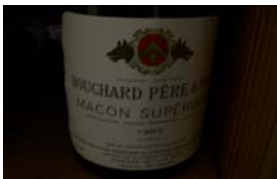
Winzer: Bouchard Père & Fils Gebiet: Burgund, Macon Jahrgang: 1989 Preis: 9,10