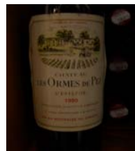
Winzer: Chateau Les Ormes de Pez Gebiet: Bordeaux, Saint-Estéphe Jahrgang: 1980 Preis: 19,90