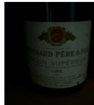
Winzer: Bouchard Père & Fils Gebiet: Burgund, Macon Jahrgang: 1988 Preis: 9,10