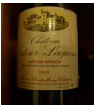
Winzer: Chateau Latour Laguens Gebiet: Bordeaux Jahrgang: 1991 Preis: 14,30