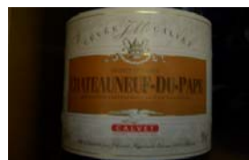
Winzer: Calvet Gebiet: Rhone, Chateaufort Jahrgang: 2000 Preis: 22,80