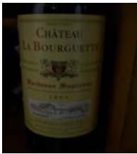
Winzer: Chateau La Bourguette Gebiet: Bordeaux Jahrgang: 1993 Preis: 11,29