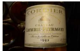
Winzer: Chateau Lafaurie-Peyraguey Gebiet: Bordeaux, Sauternes Jahrgang: 1982 Preis: 89,90