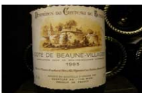
Winzer: Bouchard Père & Fils Gebiet: Burgund, Côte de Beaune-Villages Jahrgang: 1983 Preis: 23,10